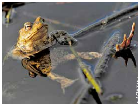
Erdkröten fühlen sich in hiesigen Tümpeln wohl.

BERN. Die Erdkröte ist heute in der Schweiz heimisch. Woher die Tiere ursprünglich stammen, war bis jetzt jedoch unklar. Forschende der Uni Bern haben nun in Zusammenarbeit mit anderen Organisationen das Rätsel gelöst. Ihre genetischen Untersuchungen zeigten, dass die hier ansässigen Erdkröten alle die gleichen Vorfahren haben. Diese wanderten vor rund 10 000 Jahren aus dem Balkan ein. Auf ihrem Weg Richtung Norden gelangten sie über die Alpen in das Gebiet der heutigen Schweiz. Hier breiteten sie sich in verschiedenen Lebensräumen aus und sind heute die häufigste Amphibienart. SAS