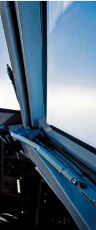
Flugzeugs. HELVETIC AIRWAYS